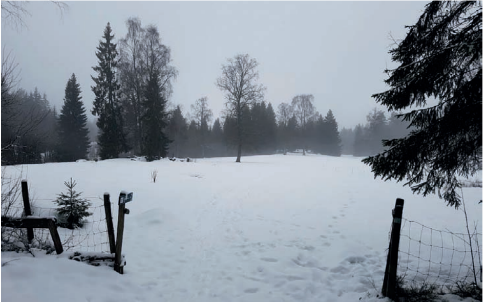
Stinaløkka sett fra skogkanten hvor stien går videre opp mot Slåttebråtan eller Småvannsbu.

Nå går det ikke dyr på beite her, men det er fremdeles en flott plass å ta en kort tur for en nistebit og kaffe. Det er utfartsparkering ved 3. avd. Også mulighet for parkering ved barnehagen men ikke i åpningstiden. Se skilting på områdene.