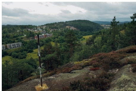
Utsikt mot Rødsåsen og Hallenskog og Røyken