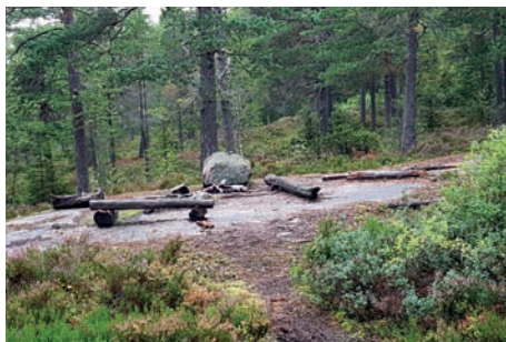
Når en kommer opp på den blåmerkede stien fra Lier til Heggedal ligger det en fin rastplass på venstre side