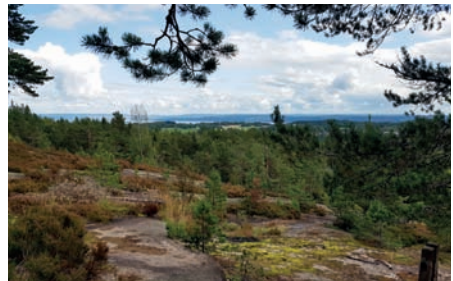
Fin utsikt fra hytteveggen

Vi gikk innom Bekkestua som var åpen for kaffe og kake. Hyggelig treff med representanter fra Heggedal og omegn historielag som drifter hytta. De har også stått for rehabiliteringen av den. Samme dag arrangerte Asker turlag fellestur fra Dikemark til Heggedal med besøk på Bekkestua.